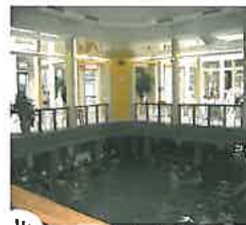
Man kan også bade innendørs der temperaturen er mellom 28 og 33 grader