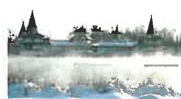
Utendørs bade temperatur i Hévíz-sjøen om vinteren ligger mellom 26 og 28 grader