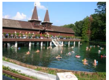
Utendørs bade temperatur i Hévíz-sjøen