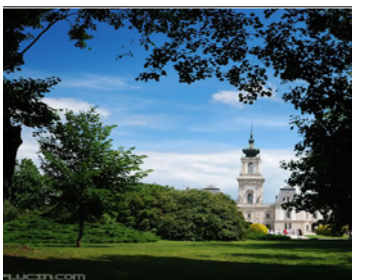
Slottet i Keszthely - nabobyen til Hévíz