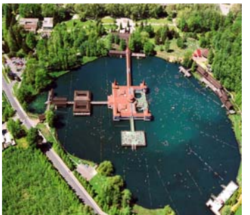
Hévíz sjøen fra fly foto